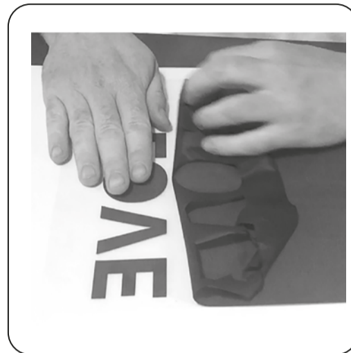
Étape 3 Échenillage