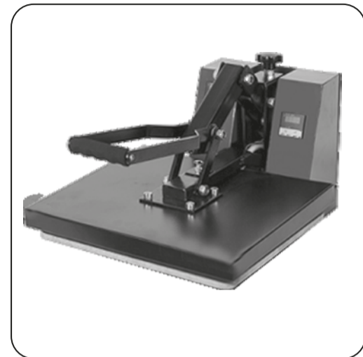
Étape 4 Pressage