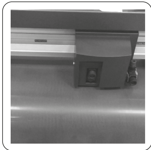
Étape 2 Découpe