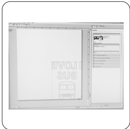
Étape 1 Conception du marquage