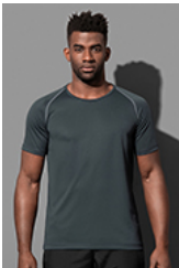
ST8030 Active 140 Team Raglan