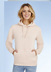
SOL'S SPENCER WOMEN 03103