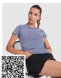
HUSKY WOMAN CA6691