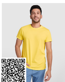
DOGO PREMIUM CA6502