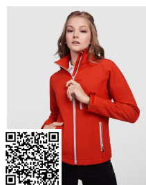
ANTARTIDA WOMAN SS6433