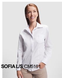
SOFIA L/S CM5161