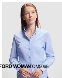
OXFORD WOMAN CM5068