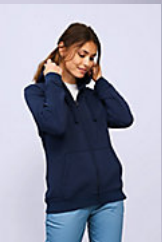
SOL'S SPIKE WOMEN 03106