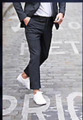
NEOBLU MARIUS MEN 03164