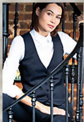
NEOBLU MAX WOMEN 03167