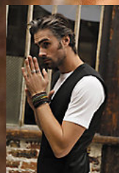
NEOBLU MAX MEN 03166