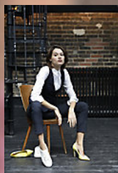
NEOBLU GABIN WOMEN 03163