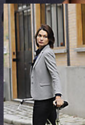
NEOBLU MARCEL WOMEN 03170