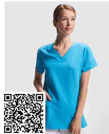
FEROX WOMAN CA9084