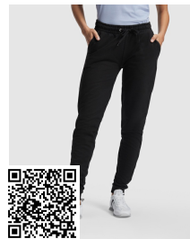
ADELPHO WOMAN PA1175