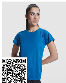
BAHRAIN WOMAN CA0408