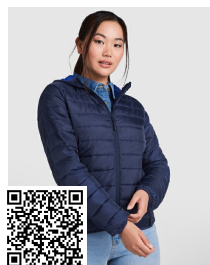
NORWAY WOMAN RA5091