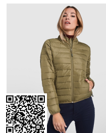
FINLAND WOMAN RA5095