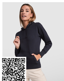
URBAN WOMAN SU1068