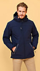
SOL'S ROCK MEN 46604