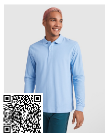
ESTRELLA L/S PO6635