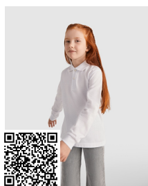
CARPE CHILD PO5008