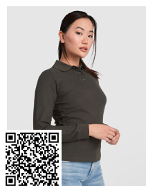
ESTRELLA WOMAN L/S PO6636