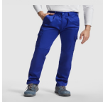
Duo Concept PA9100