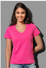
ST2700 Classic-T V-neck