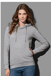
ST4110 Sweat Hoodie Classic