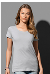
ST9500 Sharon Slub Crew Neck